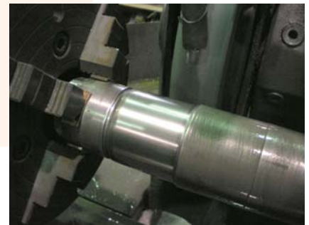
完成維修的冷卻管