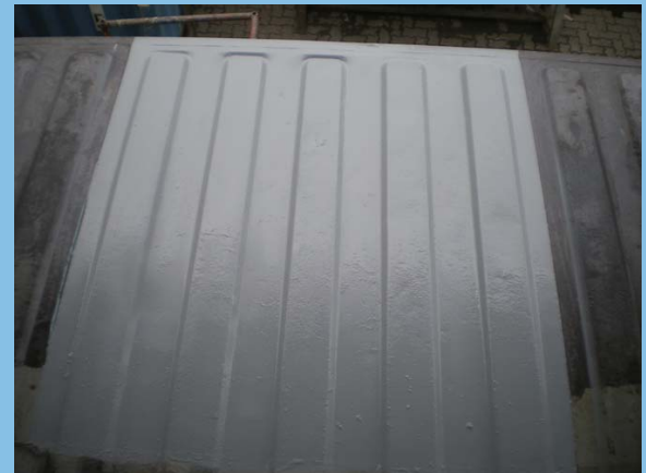
4. 12小时后，噴塗面漆即可