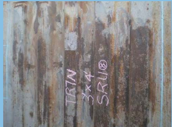
2. 用磨機清除表面的浮鏽