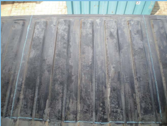
3. 表面處理完成後，噴塗防銹轉化底漆