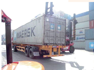
拖車在路面行駛1小時