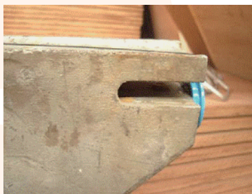
掛衣梁（衣架巴）測試後狀態-左側/右側，槽口和焊縫處並沒有出現斷裂或裂紋。