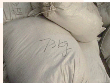
在砂袋上標注重量