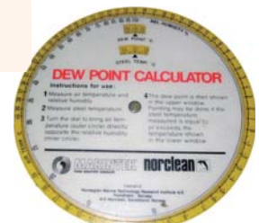
設備三：露點計算器如圖所示（或其他儀錶）