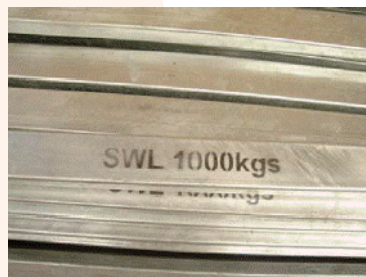
安全承重量已標注在每條梁上