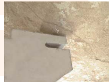
掛衣梁（衣架巴）測試前狀態-右側