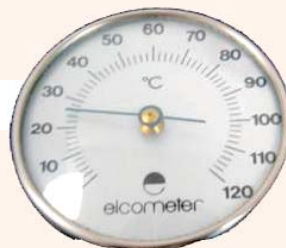
設備二：鋼表溫度平面規如圖所示（或類似儀錶）