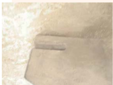
掛衣梁（衣架巴）測試前狀態-左側